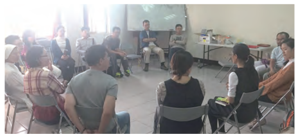
▲184屆選擇成長營傳說中的第10講