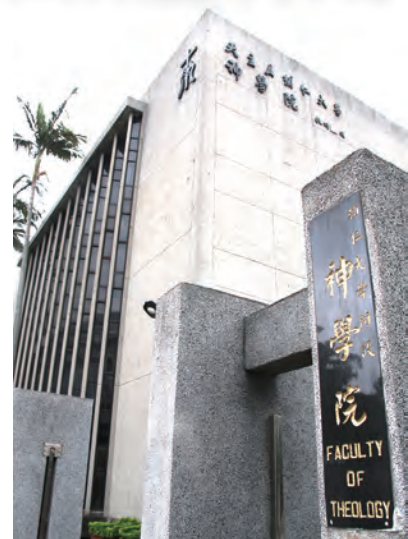
▲1967年在新莊落腳的輔神樣貌，至今仍是培育福傳人才，信仰陶成的理想地。

輔仁聖博敏神學院是由上海徐家匯耶穌會神學院蛻變而來。徐家匯神學院建於1929年；兩年後（1931年），經教廷聖部批准，可授予神學碩士學位。神學院的建立目的，是讓來自各個不同國家的耶穌會年輕傳教士，能在中國本土攻讀神學。好在當時全世界都以拉丁文教學，課本也都是拉丁文，暫時沒有語言問題。