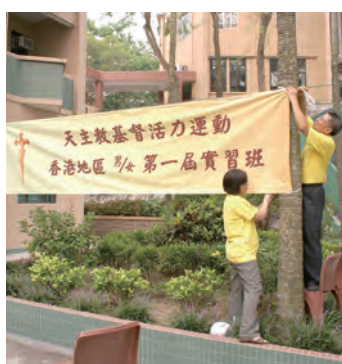
▲2008年在香港長洲島慈幼靜修院舉辦第1屆基督活力實習班，台灣的活力員兄姊們自願赴香港服務。

此就有中文版的《活力員祈禱手冊》可用，沒有他們日以繼夜的全心投入、披荊斬棘、開疆闢土、犧牲奉獻、努力傳承，就沒有現在的我們。同樣的，這份使命感也要在香港努力傳承，開花結果，發揚光大。日後，香港地區的第1屆實習班蓬蓬勃勃的茁壯，都要看第1屆種子活力員的戮力深耕，辛勞澆灌，基督活力在香港地區教會發展史的功勞簿上，首屆活力員也如拓荒者般的流血流汗，含笑收割。