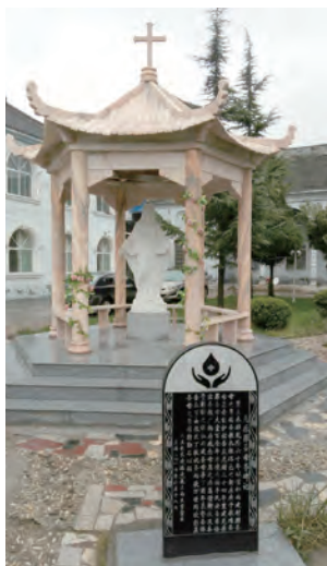
▲聖母亭的石碑上記述了聖堂沿革