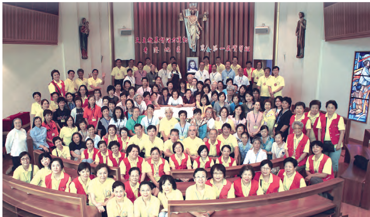
▲2008年9月12日至15日香港基督活力第1屆實習班圓滿完成，大家歡喜地合影，準備好要在香港繼續展開推廣基督活力的工作。

是的，多年前我有幸能參加香港第1屆實習班服務工作，基督長兄賜給了我深深的震撼——身在福中，要知福！今後，我將全力以赴，為把基督活力帶進大陸地區而努力，希望有生之年，能參加大陸地區舉行第1屆實習班的服務。台灣天主教會的全國總會及各分會都是香港教區活力運動的後盾，我們彼此相親相愛、相互扶持、相互支援，過去如此、現在如此、未來也如此；台灣如此、香港如此、全世界都如此，因為，在基督長兄內我們都是一家人。「因相愛，別人認出我們是活力員，別人能認出我們是活力員。」