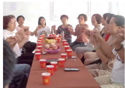
▲在內地辦實習班也播撒基督活力的種子