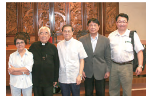
▲2013年10月10日為推展基督活力，狄剛總主教(左二)拜訪澳門教區黎鴻昇主教(中)。