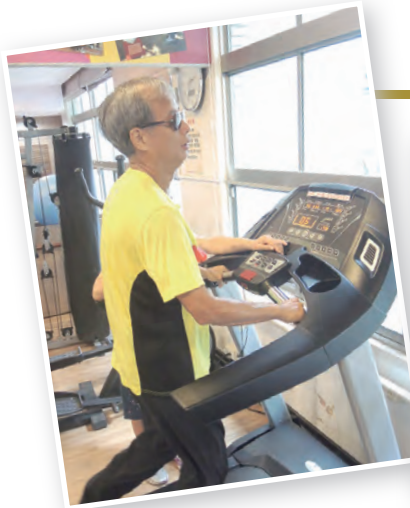
▲為參加馬拉松，時常到體適能中心提升慢跑實力是必要的。