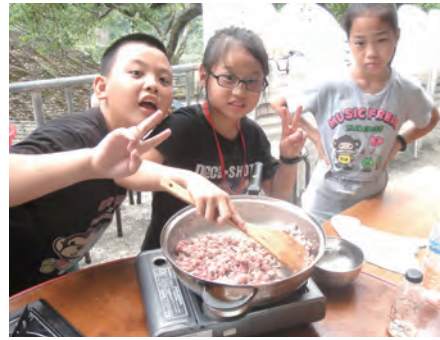
▲小福星們自己煮飯學著自己照顧自己