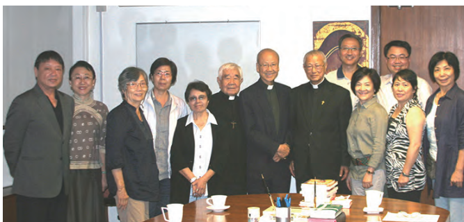
▲為推展基督活力，2013年10月10日拜訪香港湯漢樞機主教(中)，同行者都是數十年來海外華人基督活力而努力的活力員。