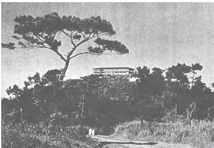
▲1952年在菲律賓碧瑤「瞭望台」(Mirador)山丘的輔仁聖博敏神學院前身——Manila Observatory and Bellarmine College。