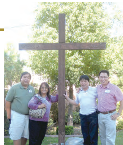
▲2010年10月為慶祝基督活力在北美人推行20周年時，活力員弟兄參觀美國洛杉磯的實習班，與亞太區的關島代表(左一、左二)合影。