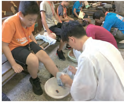
▲小福星與服務人員為彼此洗腳