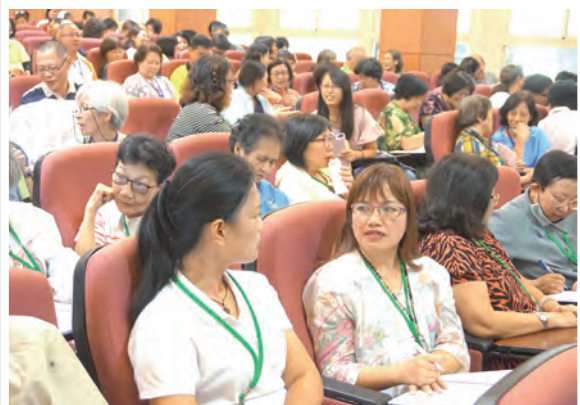
▲學員們倆倆分享，實際感受操練的果效。

方玉華老師特別推薦大家閱讀由理查神父所著的《神啊！祢是來整我們的嗎？——上主的美善 vs. 邪惡的苦難》（2014年，光啟文化出版）幫助我們更了解天主為何允許痛苦存在？我們受苦的時候，祂在哪？也教我們如何陪伴受苦的人。