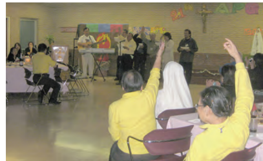
▲2010年10月慶祝基督活力在北美人推行20周年，特於洛杉磯舉行21屆亞太會議，並有精彩的晚會共融。