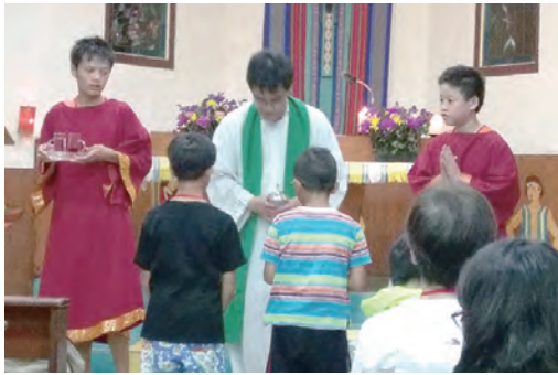
▲小福星們在彌撒中參與禮儀服務