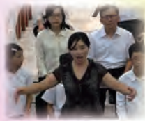
聖母悼歌音樂會 (MOD藝文饗宴)