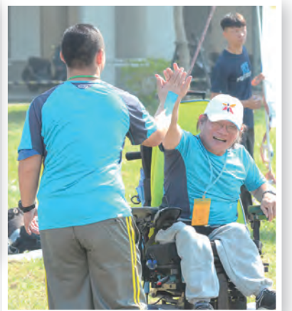
▲在戶外進行樂樂棒球比賽，玩得好開心！