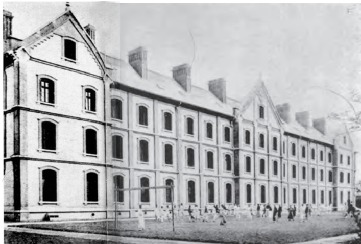
▲1929年耶穌會於上海徐家匯創立的神學院