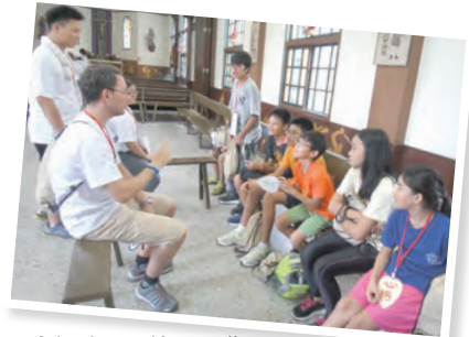
▲小組時間，彼此認識