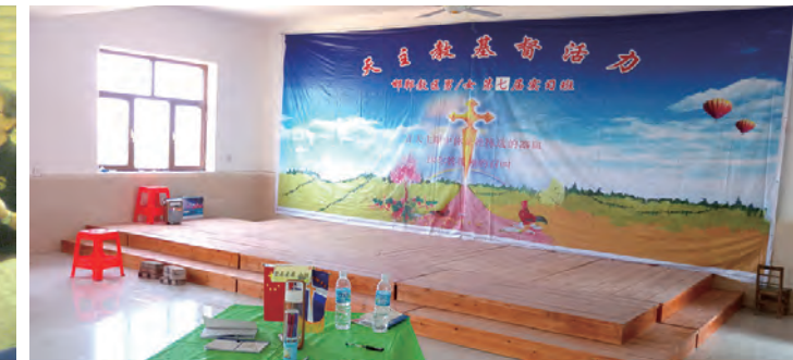
▲在河北的一個教區辦第7屆實習班的現場布置