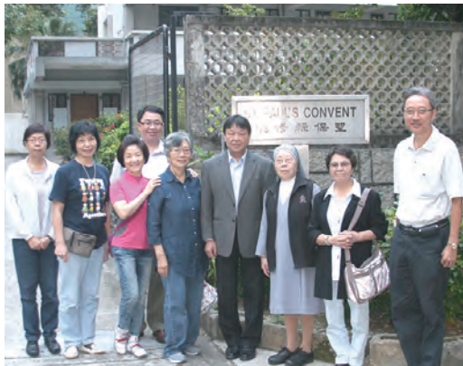
▲2013年10月9日台灣活力員兄姊赴香港推展基督活力，一行人於拜會活動之後在聖保祿修院前合影。

而今，從香港誕生了第一批的活力員種子的那一刻起，便肩負起了傳揚活力的責任及使命。49年前，基督活力進入台灣時，第1屆的活力弟兄們參加了全是英文的實習班。結束後，他們僅僅花了幾個月的時間，就將英文的《實習祈禱手冊》翻譯成中文版，從