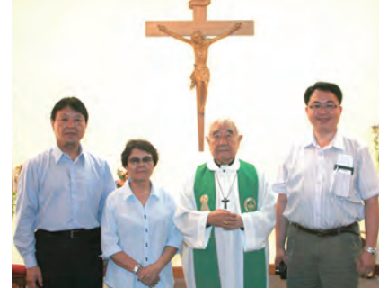
▲2013年10月10日於澳門推展基督活力時，在澳門的主教公署彌撒後留影。