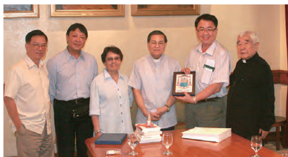
▲為基督活力推展，活力兒姊妹與狄剛總主教(右)拜訪澳門教區的黎鴻昇主教(右三)及澳門副主教(左)。