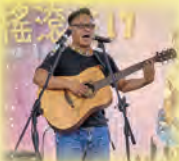
音祢搖滾在17 (MOD藝文饗宴)