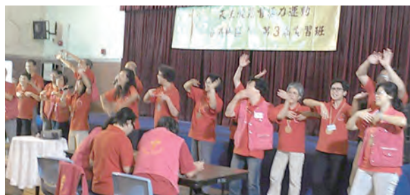
▲香港基督活力第3屆實習班活動場景，看！兄姊們多開心！