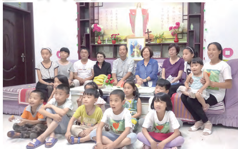
▲2017年10月內地辦實習班期間與當地孩子們合影

的一群華僑活力弟兄，他們肩負著「開疆闢土」的先驅任務，把基督活力運動帶來台灣植根。並為主辦第1屆實習班付出了極大的心力與犧牲。他們「追求理想，完全奉獻，實踐愛德」的精神，給後繼者立了榜樣。60年代的台灣，各方面都是艱困的，財力、物力也不充裕，人力缺乏之下，教友擔負沉重。但有眾多「拓荒」先輩們的「披荊斬棘」，才有今日的宏觀。