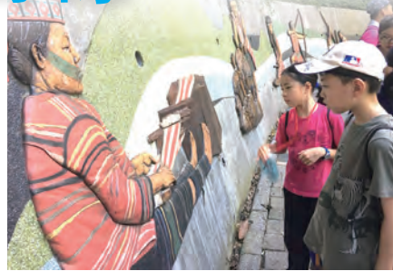
▲小福星們探訪清泉

我們在最後兩天也邀請家庭其他成員一起來營中。孩子們先為爸媽準備午餐，下午則請專業導覽為大家介紹清泉，彌撒感恩祭結束後到餐廳享用晚餐，品嚐當地餐廳為我們精心設計的「原住民風味餐」，晚上還有精彩的晚會，大家玩得不亦樂乎。主日一起參加清泉天主堂的祭祖奉獻感恩彌撒，這是清泉天主堂的傳統，堂區的原住民教友在每年的聖母升天節，慶祝他們的祭祖奉獻，我們也與他們一同歡慶，就在這歡樂的共融中，2017「山中奇緣」聖體生活營圓滿地畫下句點。