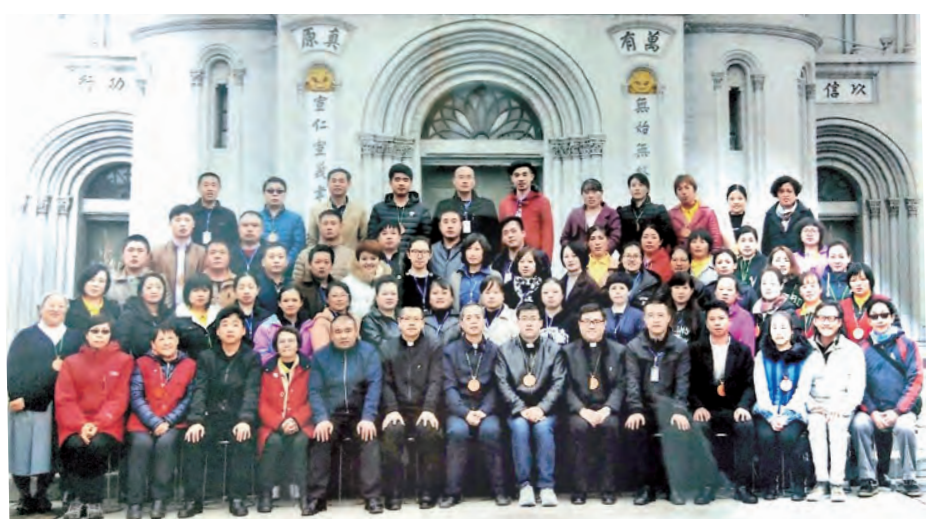
▲山西省的一個教區舉辦第1屆男女實習班，圓滿完成。