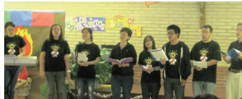
▲2010年10月為基督活力北美華人推行20周年於洛杉磯舉行21屆亞太會議，共融晚會中洛杉磯的華人青年作精彩表演。