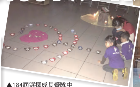
▲184屆選擇成長營隊中 小小營管的祈禱——求主垂憐。 ◀選擇成長營隊中，大家專心聆聽分享。 ▶184屆選擇成長營即使營管比學員還多，營隊也照常舉辦，且圓滿成功。