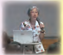
教你如何讀經 (MOD學習與成長)