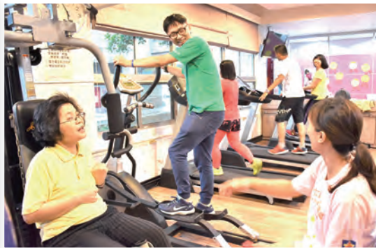
▲身心障礙者都可以到美善基金會的「身心障礙者體適能中心」享受健康運動。