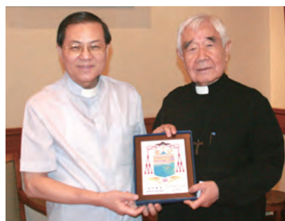
▲2013年10月10日為基督活力推展神師狄剛總主教(右)拜訪澳門教區黎鴻昇主教。